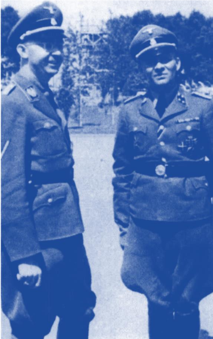
1 Heinrich Himmler und Rudolf Höss (rechts), Kommandant von Auschwitz, während Himmlers Besuch des Lages im Juli 1942