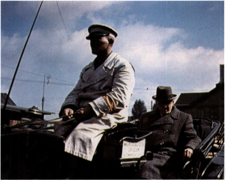
7 Mordechai Chaim Rumkowski (rechts), Vorsitzender des Ältestenrates im Ghetto von Łódź, eine kontroverse, wenn nicht berüchtigte Person