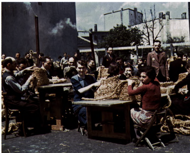
9 Jüdische Männer und Frauen flechten Körbe in einer provisorischen Werkstatt im Ghetto von Łódź.