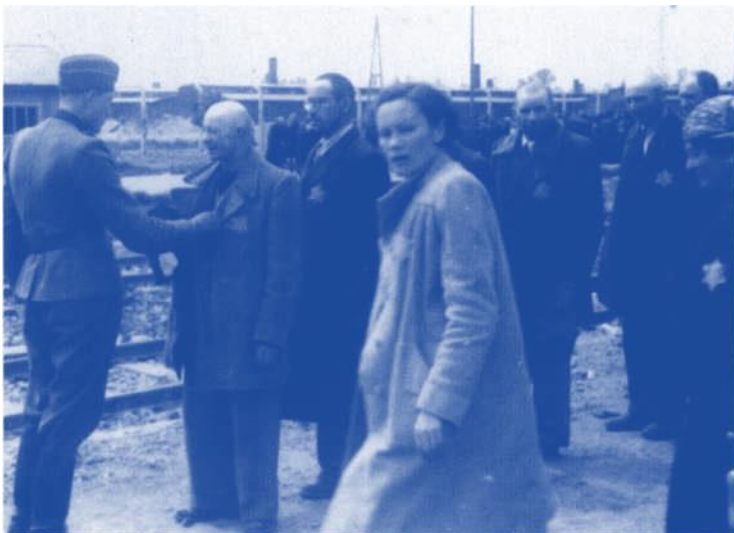
23 Diese jüdischen Männer werden von einem Arzt begutachtet. In einem Augenblick entscheidet er über Tod und Leben.