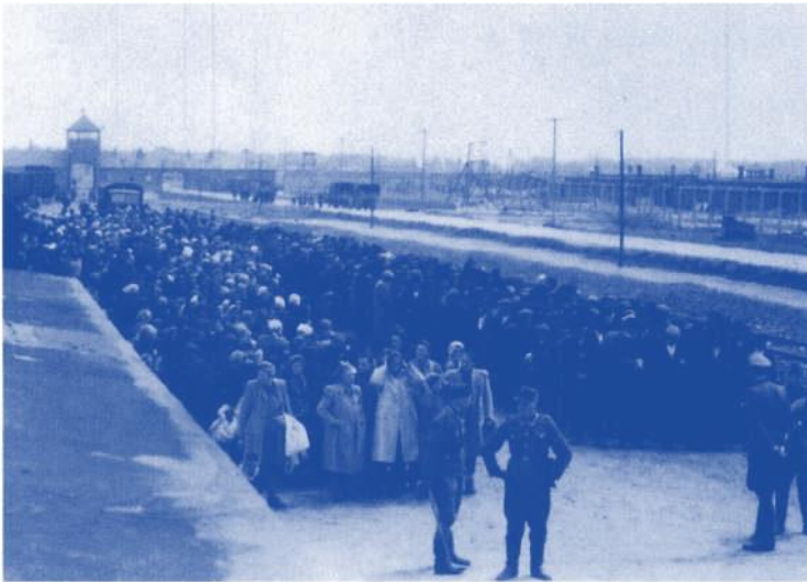
22 Nach der Geschlechtertrennung wird nun die berüchtigte Selektion beginnen.