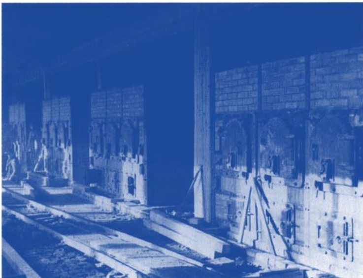
25 Die Öfen der Krematorien von Auschwitz