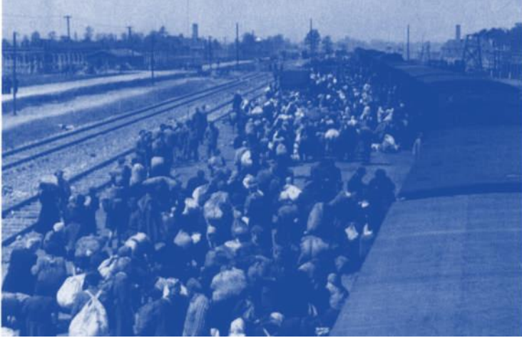
20 Ein Transport mit ungarischen Juden kommt im Frühsommer 1944 in Auschwitz-Birkenau an. Die Schornsteine der Krematorien 2 und 3 sind im Hintergrund rechts und halb links zu sehen.