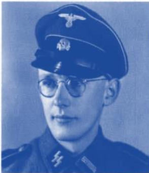
16 Oskar Gröning, der im Herbst 1942 nach Auschwitz kam