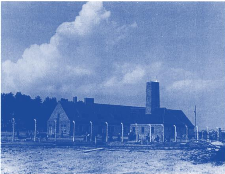
27 Krematorium 3, in der Nähe der Rampe von Birkenau. Hier war die Gaskammer im Keller.