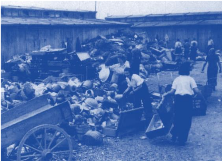
15 «Kanada», die Sammelstelle in Birkenau, wo Häftlinge die Habseligkeiten der Neankömmlinge sortierten