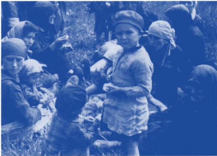
24 Eine jüdische Familie aus Ungarn, die nach ihrer Selektion in der Nähe der Krematorien 4 und 5 wartet