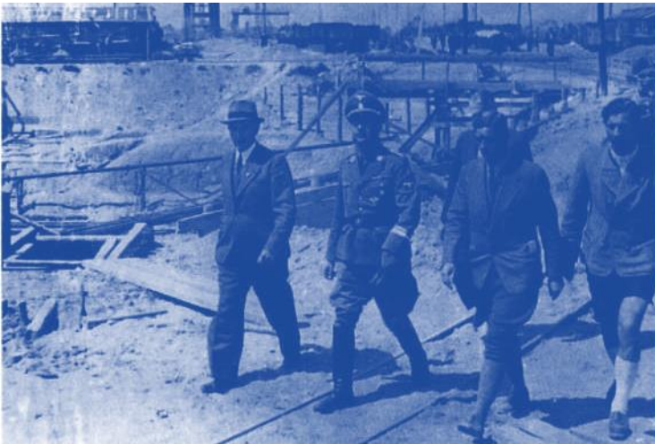
12 Himmler äusserte sich zufrieden über die Fortschritte in Auschwitz und beförderte anschliessend Höss zum SS-Obersturmbannführer.