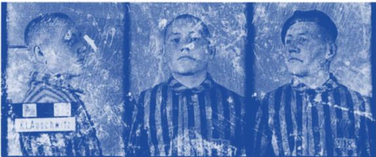
17 Kazimierz Piechowski, ein polnischer «politischer» Häftling, der an einer der spektakulärsten Fluchtversuche aus Auschwitz teilnahm