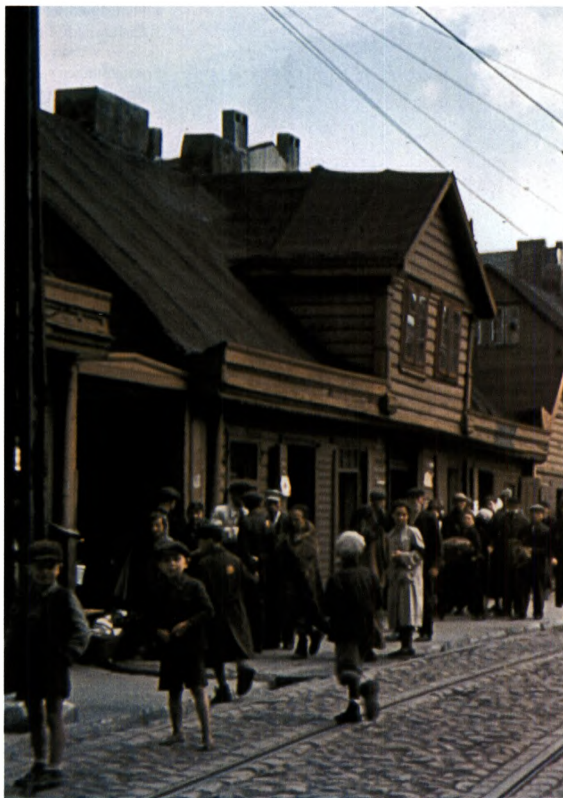
6 Ein Straßenszene im Ghetto von Łódź (Litzmannstadt). Die überwiegende Mehrheit der Menschen auf diesem Photo wurden bis zum Herbst 1944 ermordet.