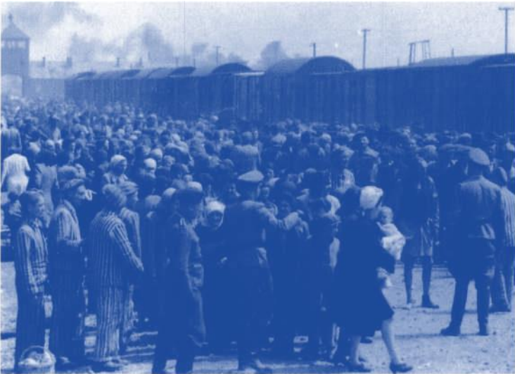
21 Nach ihrer Ankunft werden die getrennt.