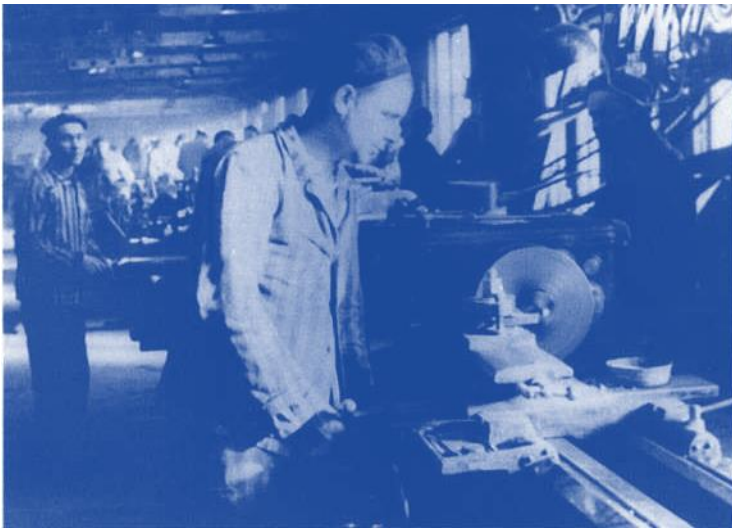
13 Auschwitz-Häftlinge in einer der vielen Werkstätten im Umkreis des Lagers