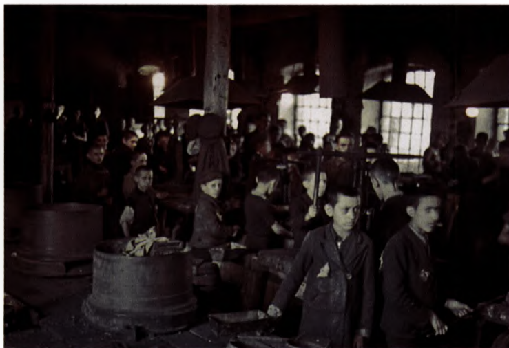
10 Auch Kinder mußten im Ghetto arbeiten – keine Beschäftigung zu haben, erhöhte das Risiko, deportiert zu werden.