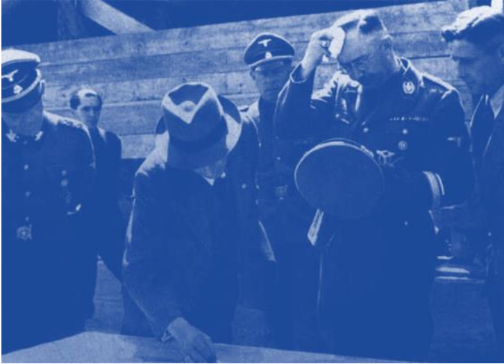
11 An einem heissen Sommertag 1942 inspiziert Himmler Pläne für eine grosse Gummi-Fabrik in Monowitz (Monowice), der grössten Industrieanlage im Gesamtkomplex Auschwitz.