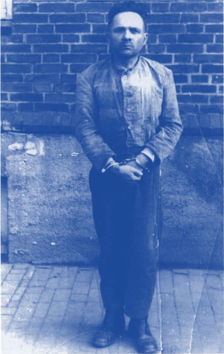
28 Rudolf Höss in Gefangenschaft