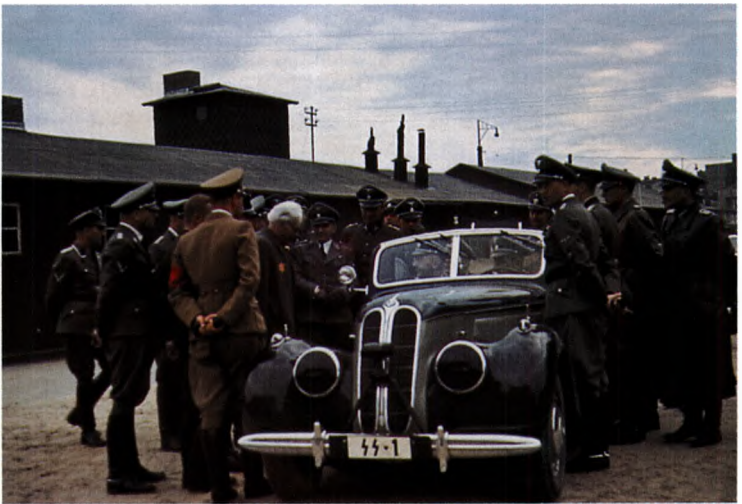
8 Rumkowski, mit weißem Haar, spricht mit Himmler während dessen Besuch im Ghetto.