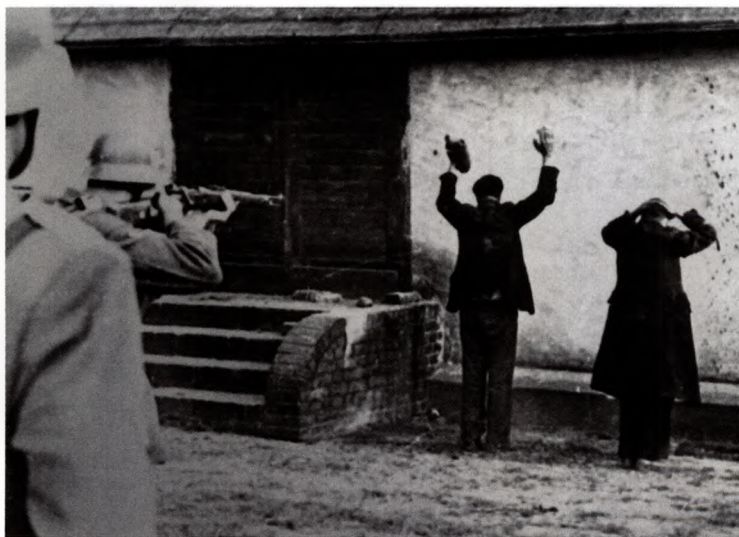
5 Eine Exekution – irgendwo im Osten. Während der deut- schen Besatzung war dies ein alltäglicher Anblick.