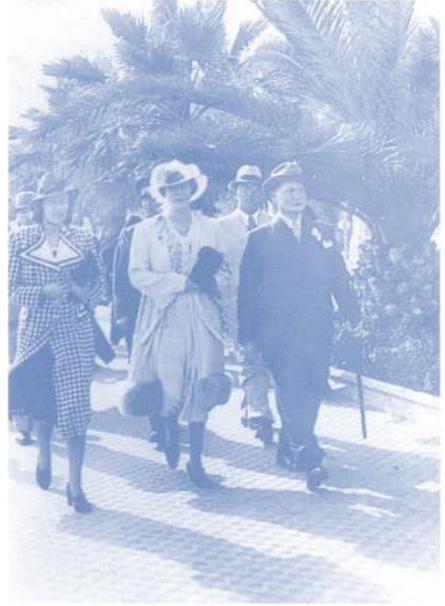
Göring (ganz rechts) auf Erholungsurlaub in San Remo, 8. März 1939