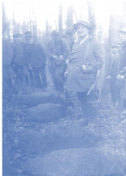
Reichsjägermeister Göring auf Wildschweinjagd im Staatsforst Spring, November 1934