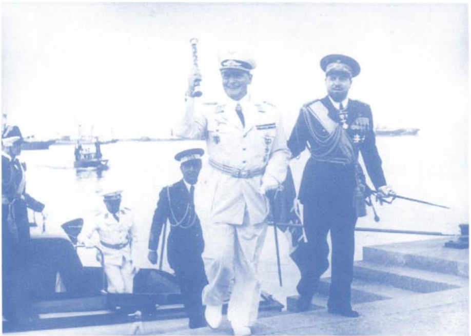
Göring als Urlauber beim italienischen Luftmarschall Italo Balbo in Tripolis