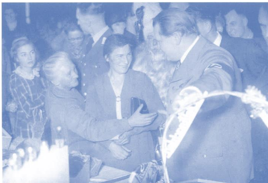
Propagandawirksame Volksnähe: «Onkel Göring lädt 2'000 Berliner Kinder ein» (Presstext, Weihnachten 1937)