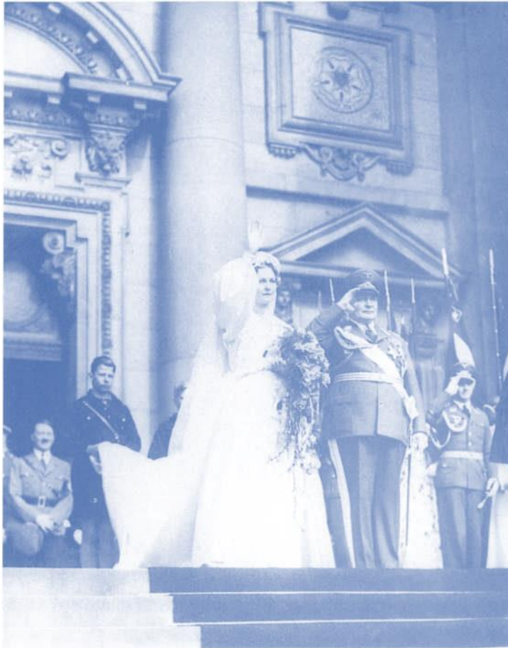
Göring mit seiner zweiten Frau Emmy von Sonnemann nach der kirchlichen Trauung am 10. April 1935