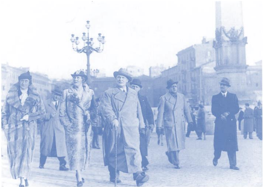
Göring (mit Stock) in politischer Mission in Rom, 14. Januar 1937