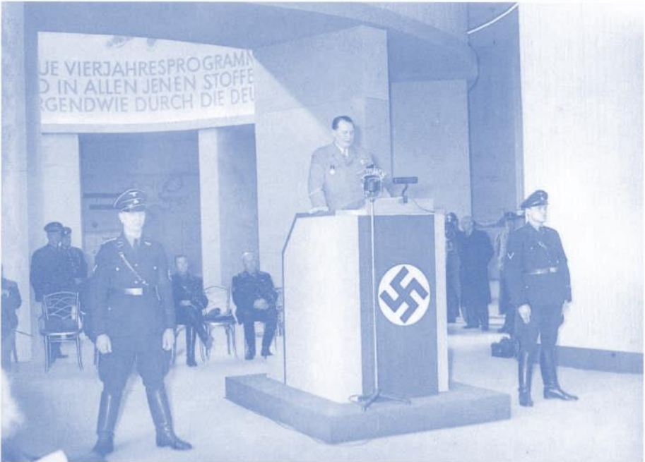
Göring als Beauftragter für den Vierjahresplan bei der Eröffnung einer Textilschau in Berlin, 24. März 1937