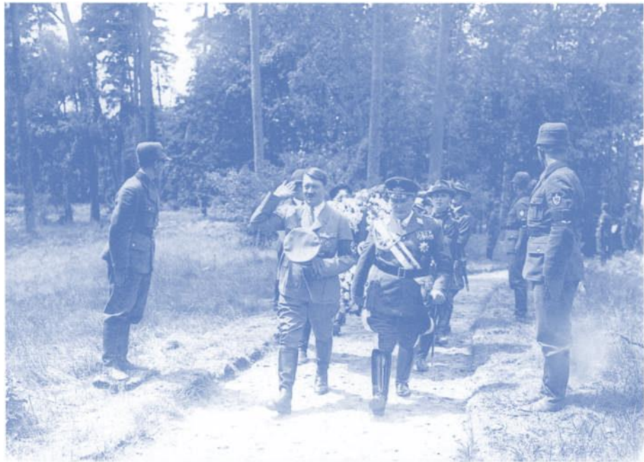
Hitler und Göring bei der Überführung von Görings verstorbener erster Frau Karin von Schweden in die Schorfheide am 19. Juni 1934