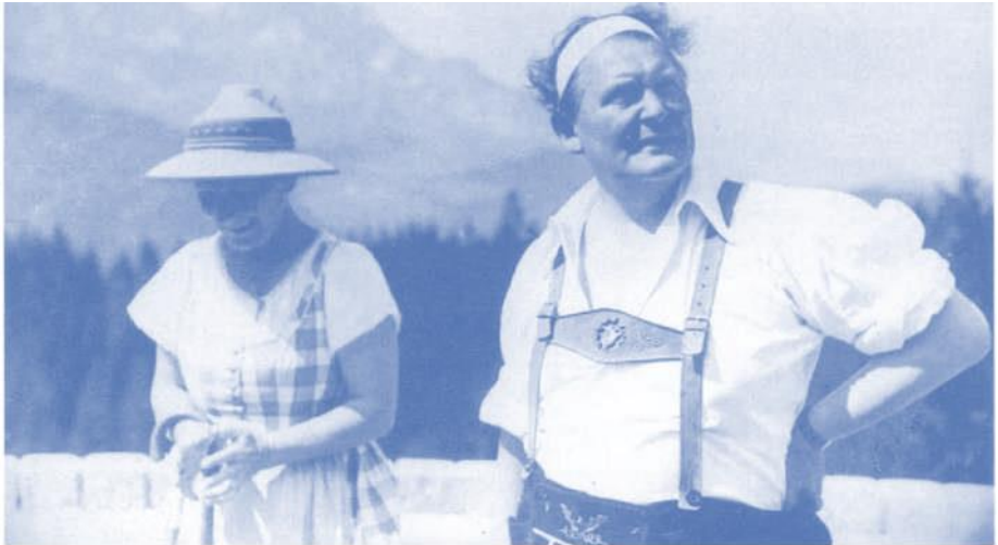
Urlaub vor dem Überfall auf Russland: Emmy und Hermann Göring auf dem Obersalzberg, Juni 1941