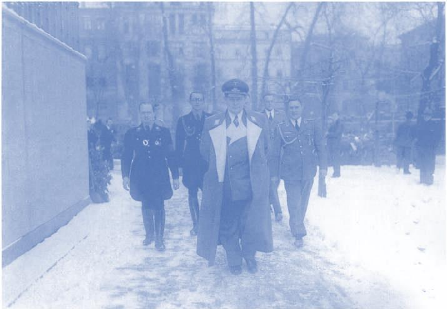
Göring and seine engsten Mitarbeiter: Paul Körner, Erich Gritzbach, Karl Bodenschatz (von links hinter Göring), 12. Januar 1935