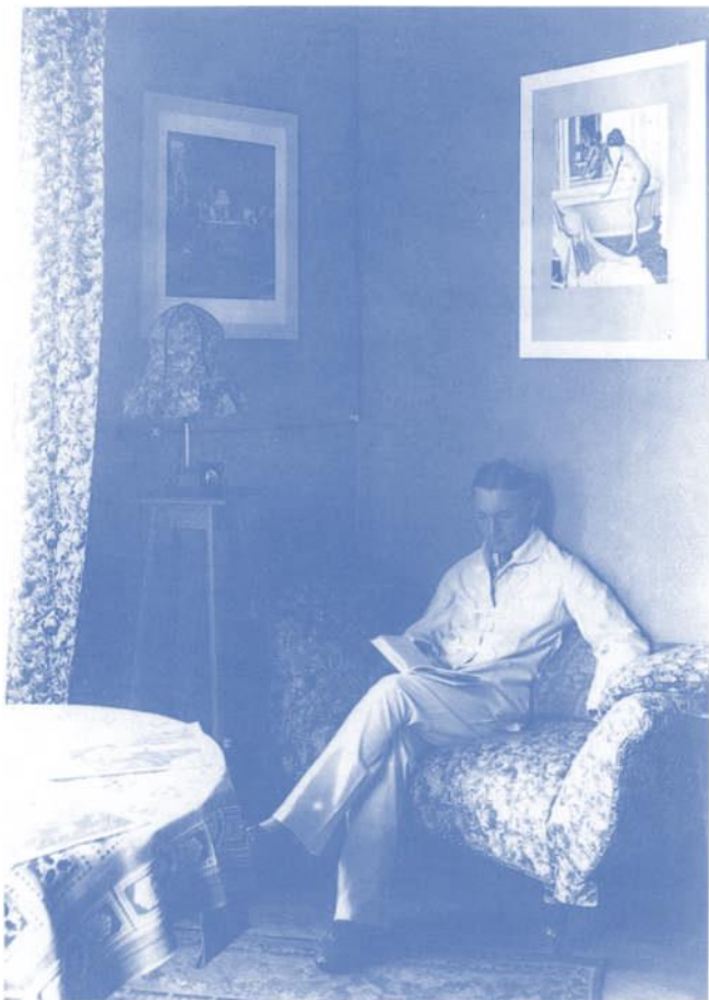
Leutnant Göring auf Fronturlaub: «Schlafzimmer, Sofaecke», Juni 1916