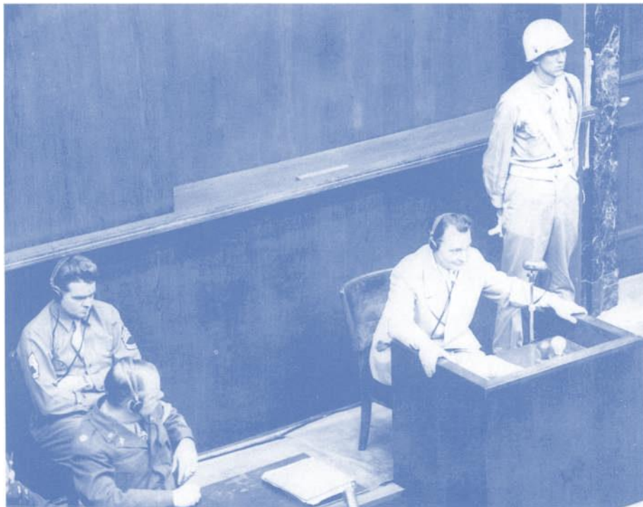
Göring als Angeklagter vor dem Internationalen Militärgerichtshof in Nürnberg, März 1946