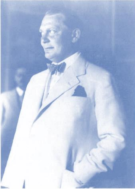
Als Sonderbeauftragter für Südosteuropa in Griechenland, 18. Mai 1934