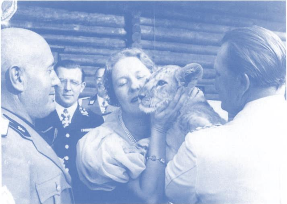
Benito Mussolini (Emmy mit Löwenbaby) und Hermann Göring (von links) in «Carinhall» 28. September 1937