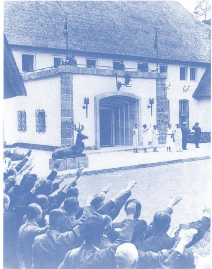
Der «Waldhof Carinhall» in der Schorfheide, Privatresidenz Görings (3. von rechts), Foto vom 20. Juli 1937