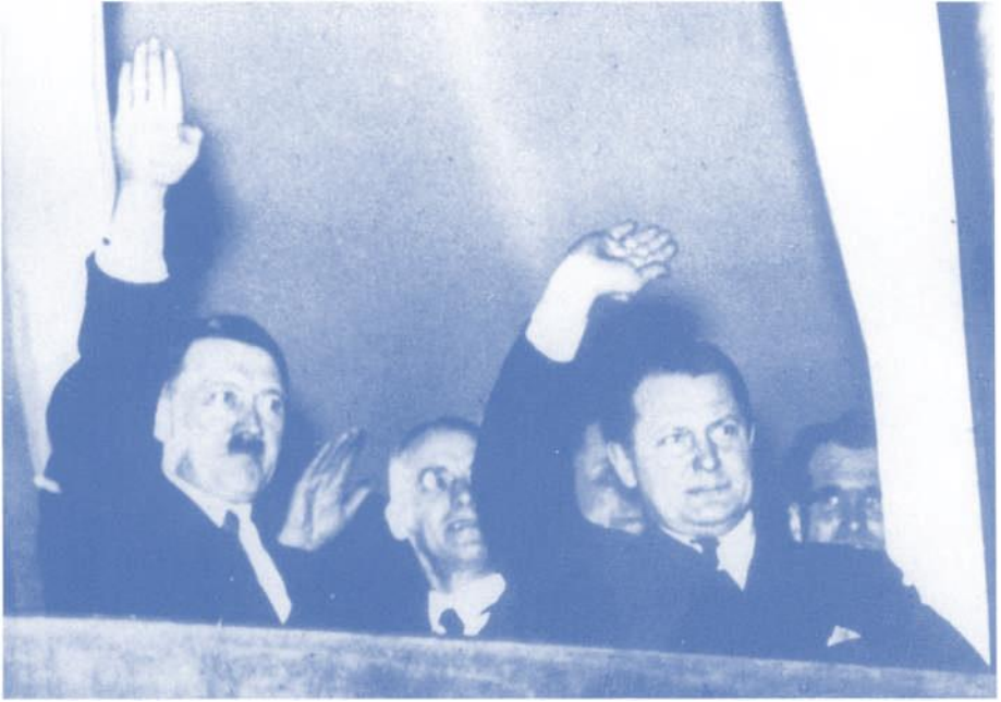
30. Januar 1933: Hitler und Göring am Fenster der Reichskanzlei