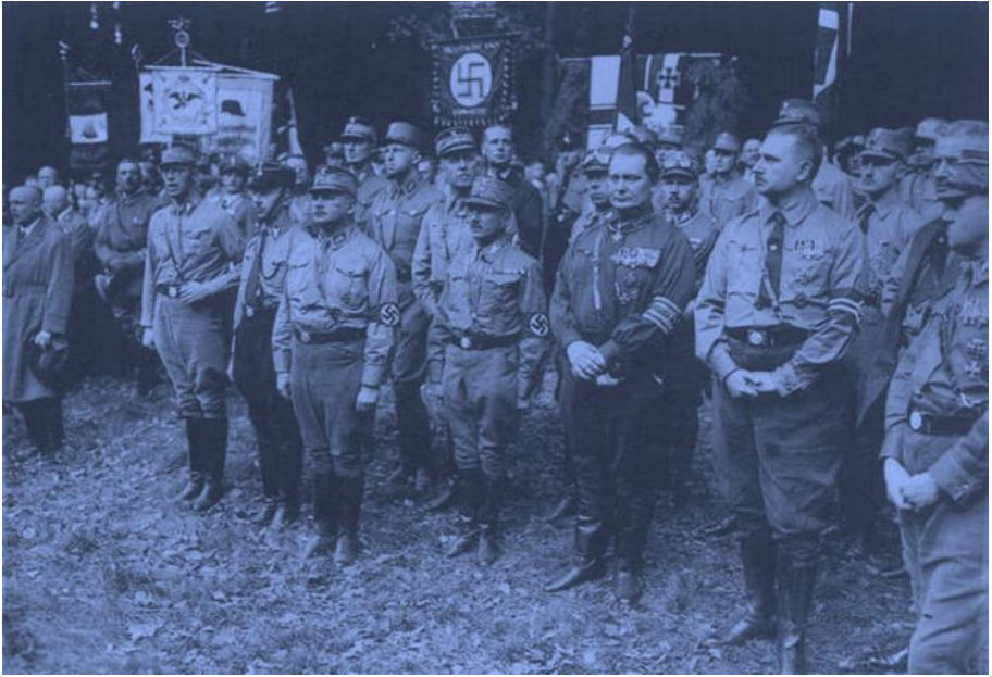
Göring, 3. von rechts, bei der Gründung der «Harzburger Front» am 11. Oktober 1931