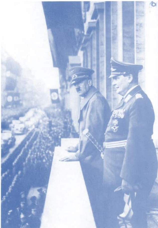
Hitler und Göring auf dem Balkon der Reichskanzlei beim Parteaufmarsch anlässlich des 'Anschlusses' Österreichs, 16. März 1938