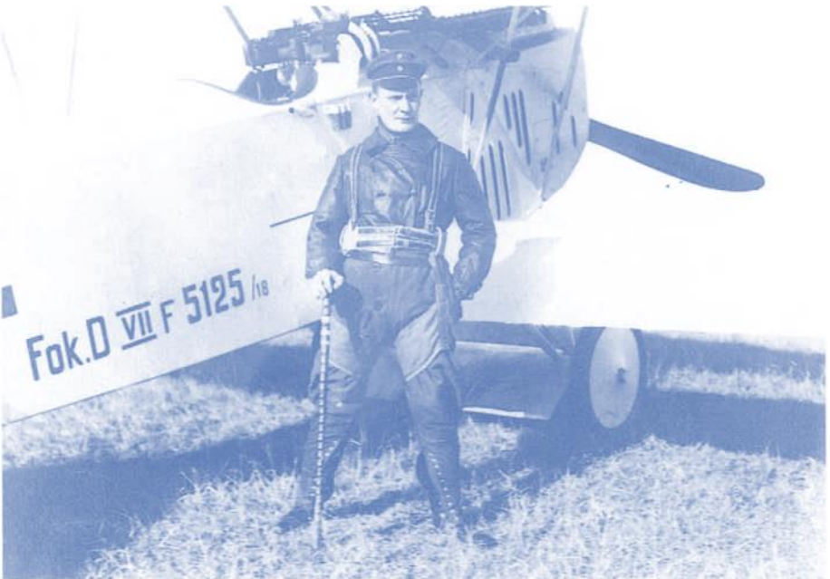
Göring als Kommandeur des Jagdgeschwaders Manfred Freiherr von Richthofen mit Richthofers «Geschwaderstock», Sommer 1918