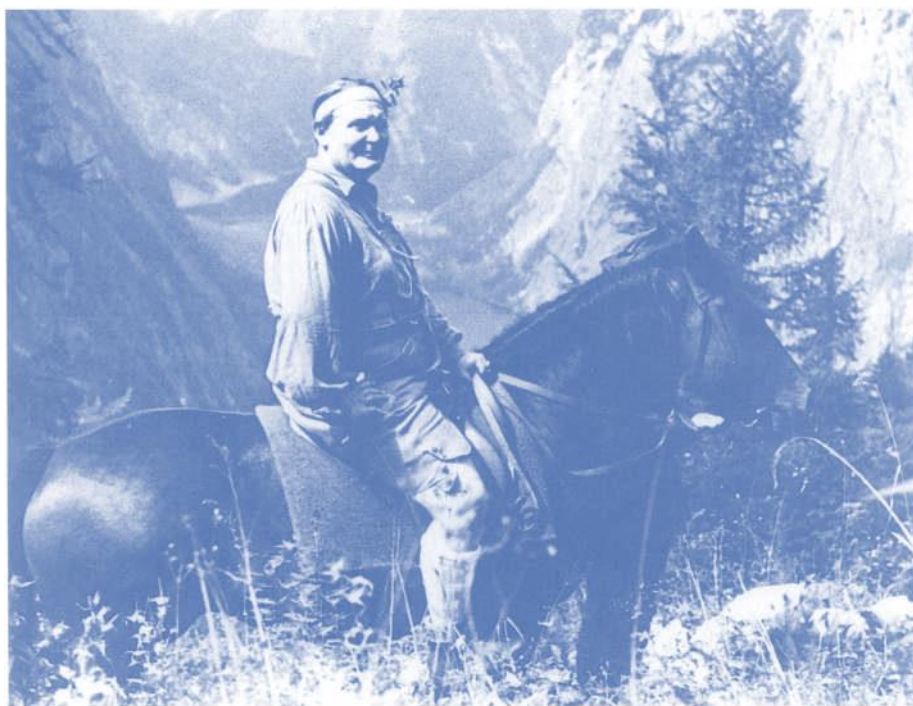
Jagdaufenthalt, August 1937