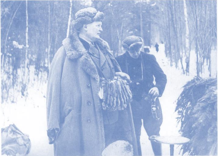
Göring auf der polnischen Staatsjagd im Bialowiezer Forst. Ende Februar 1938