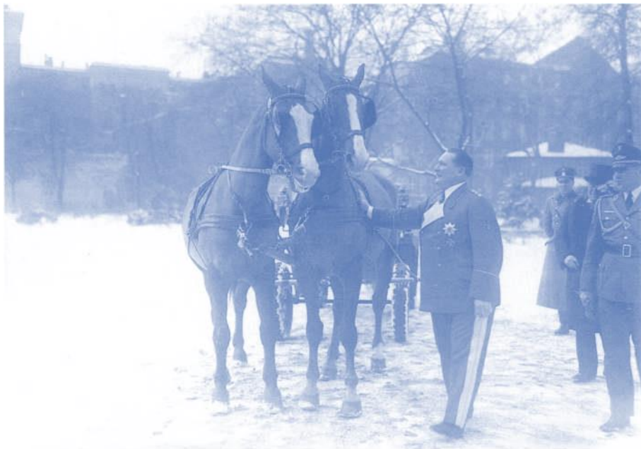
Göring bei der Besichtigung eines Geschenkes zu seinem 42. Geburtstag, 12. Januar 1935