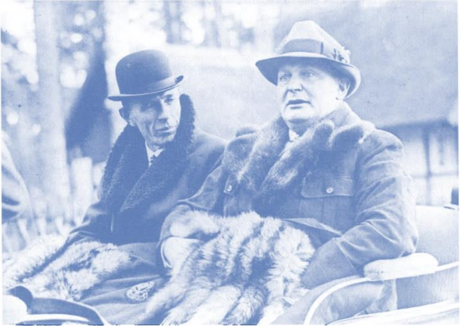
Göring (rechts) und der englische Lordsiegelbewahrer Lord Halifax in der Schorfweide am 20. November 1937