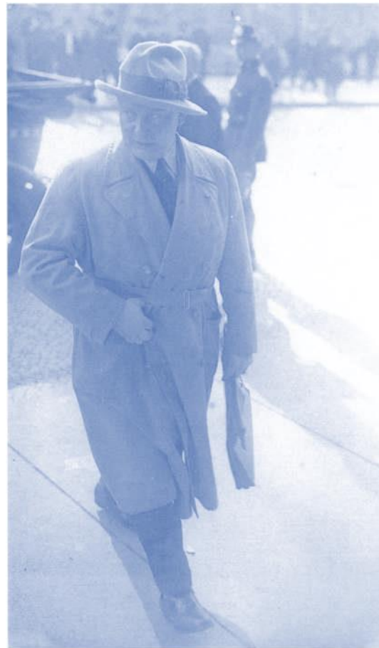
Reichstagspräsident und Abgeordneter Göring, 1932