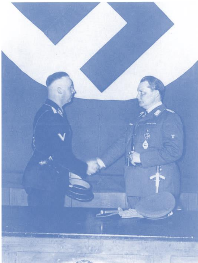
Offizielle Übergabe von Görings Geheimer Staatspolizei an Reichsführer SS Heinrich Himmler am 20. November 1934