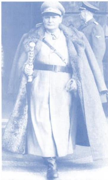
Reichsmarschall Göring beim Verlassen des Reichsluftfahrtministeriums nach der Rede zum 10. Jahrestag der «Machtergreifung»