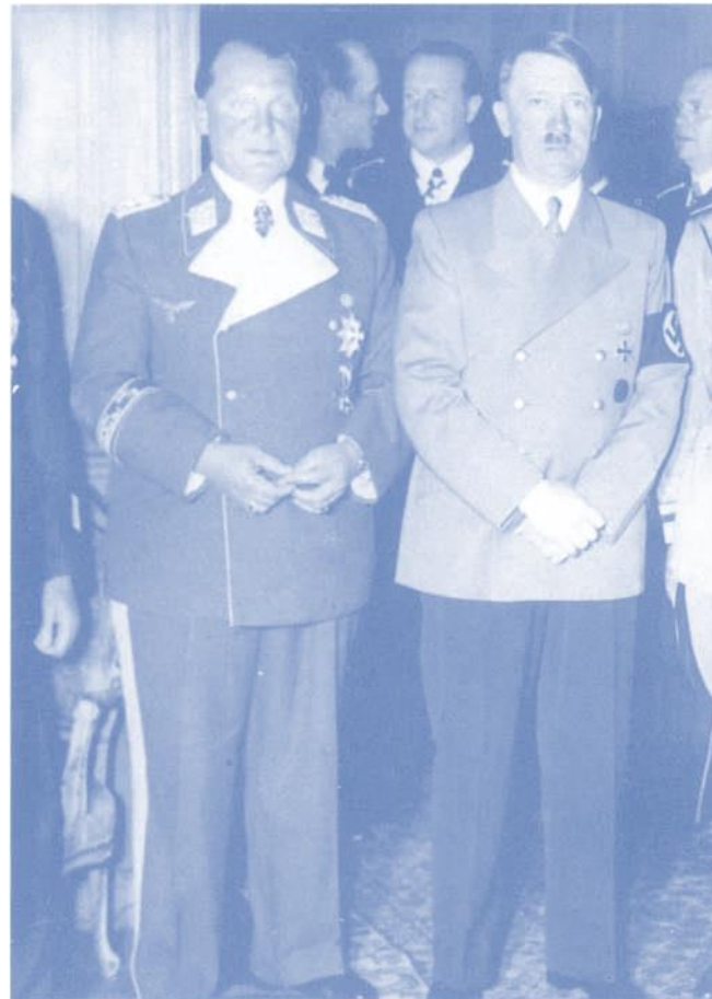
Göring und Hitler beim Festakt zur Feier des Abschlusses des deutsch-italienischen «Stahlpaktes», 22. Mai 1939