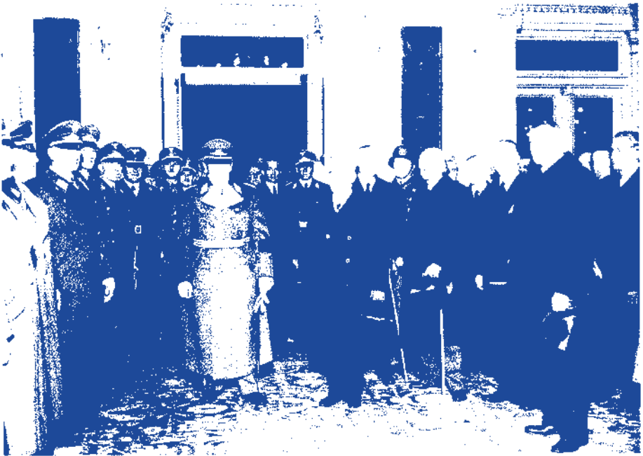
Göring (Mitte links) in Budapest als deutscher Delegierter bei der Beisetzung des ungarischen Ministerpräsidenten Gömbös, Oktober 1936