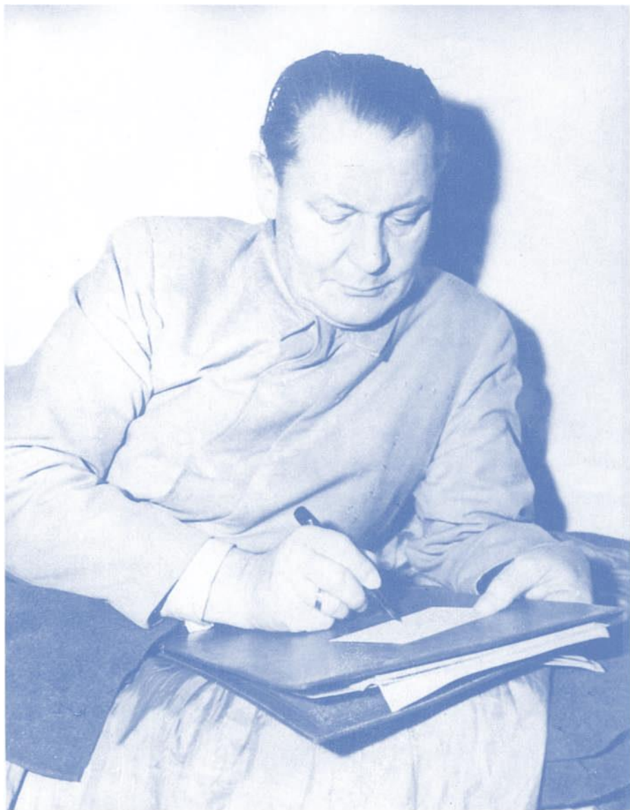
Eines der letzten Fotos vor seinem Selbstmord in der Nacht vom 15. Oktober 1946: Göring schreibend in seiner Zelle