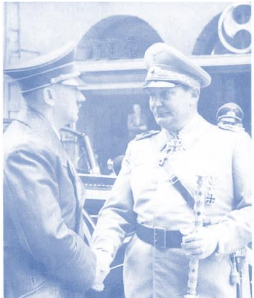
Hitler und Göring beim Staatsakt für den toten Generalluftzeugmeister Generaloberst Ernst Udet am 22. November 1941