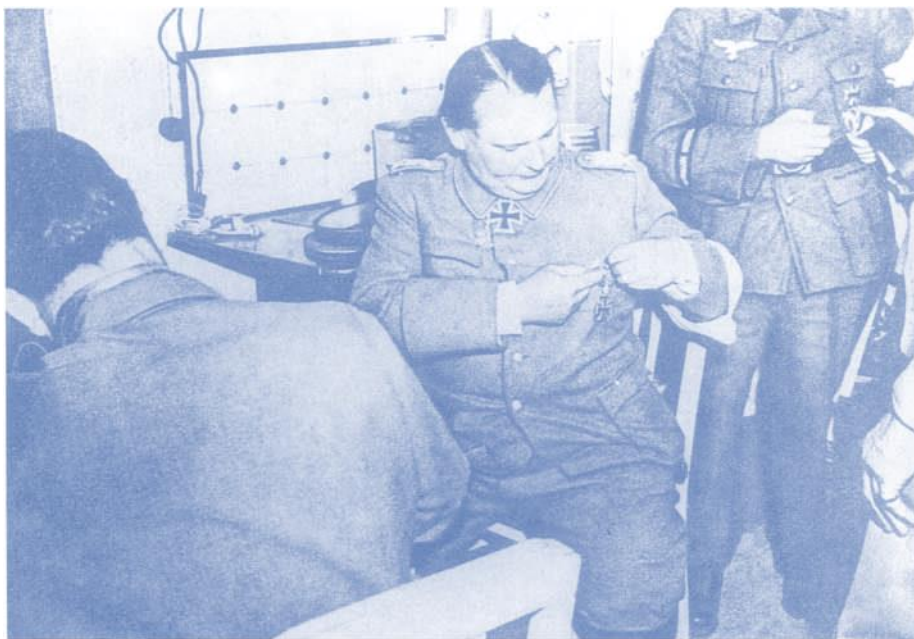
Mai 1945: Göring legt in amerikanischer Gefangenschaft Orden und Ehrenzeichen ab