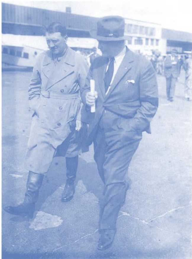
Der «Führer» und sein «politischer Bevollmächtigter»: «Eine Aufnahme aus der Zeit seines Kampfes um das Deutsche Volk» (Presstext)