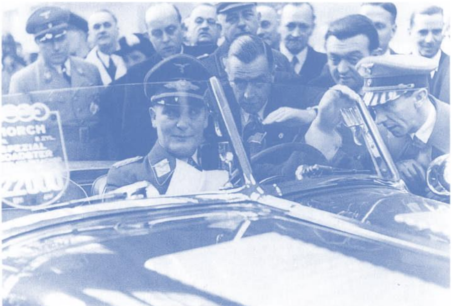
Göring (im Auto) bei der Eröffnung der Automobilausstellung in Berlin am 18. Februar 1938 (vorne rechts: Goebbels)