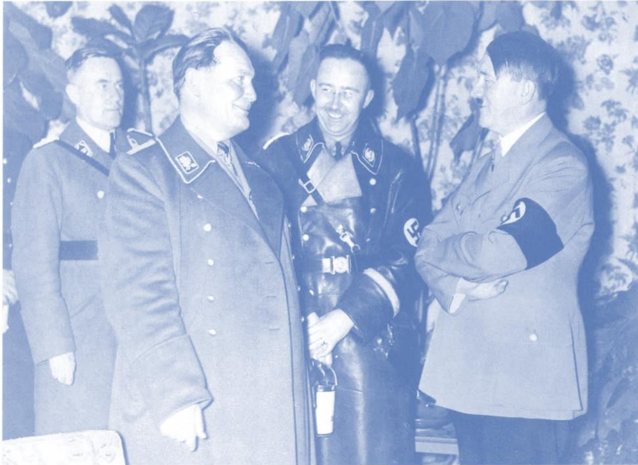
Komplizen bei den Säuberungen des Jahres 1934: Göring, Himmler und Hitler (von links) am 8. Dezember 1934