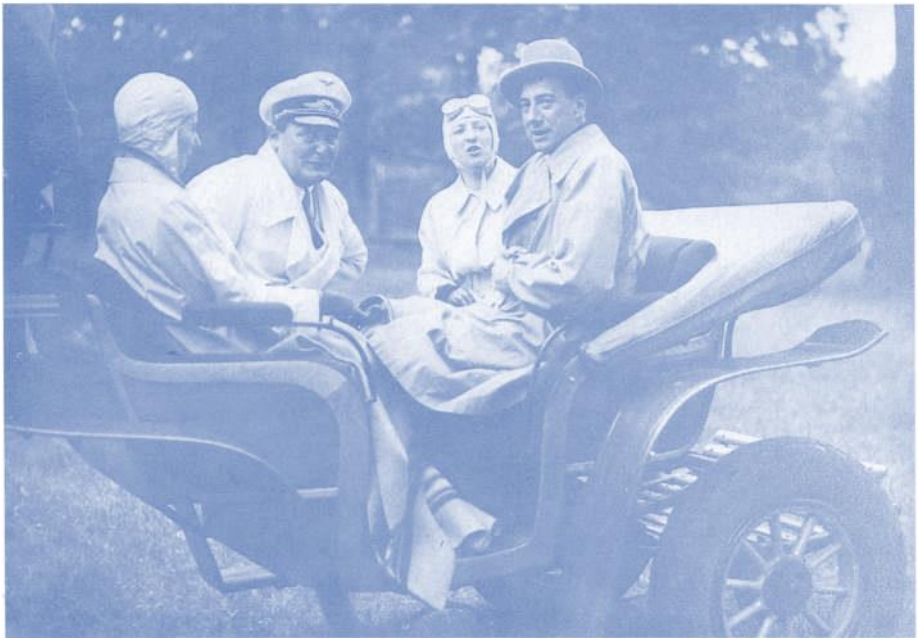
Göring (2. v. links) mit dem polnischen Aussenminister Beck in der Schorfweide. Juli 1935