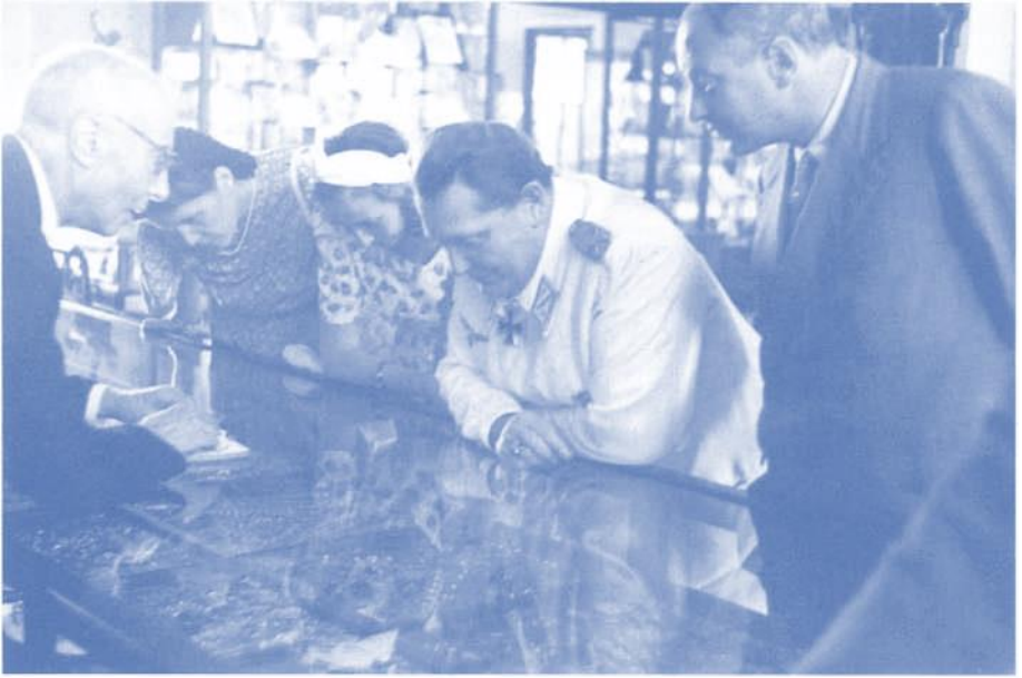
Ablenkung vom Kriegsgeschehen: Göring als «grösster Kunstsammler Europas» beim Juwelier