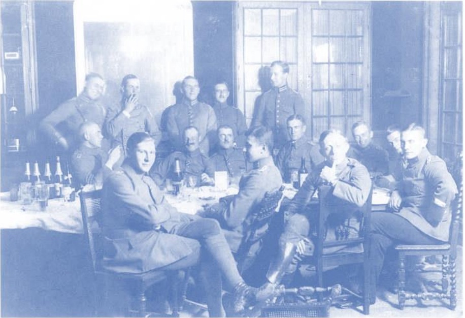
Göring (ganz rechts) als Anfänger im Kreis der Feldflieger: «Im Casino von Vonziers, November 1915» (Privatalbum H. Göring)