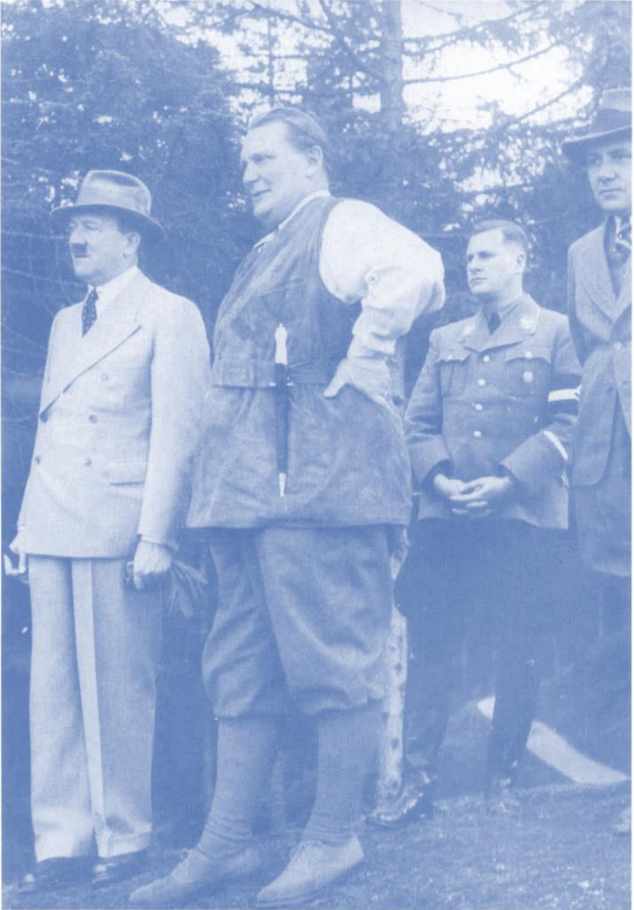
Hitler und Göring (daneben Baldur von Schirach) im Park des «Berghofes» auf dem Obersalzberg, Oktober 1936