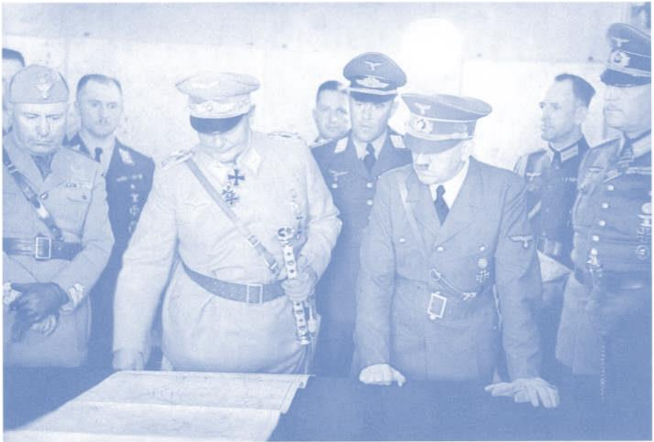
Göring (Mitte) als seltener Teilnehmer bei Hitlers Kriegslagebesprechungen im Führerhauptquartier, links: Mussolini