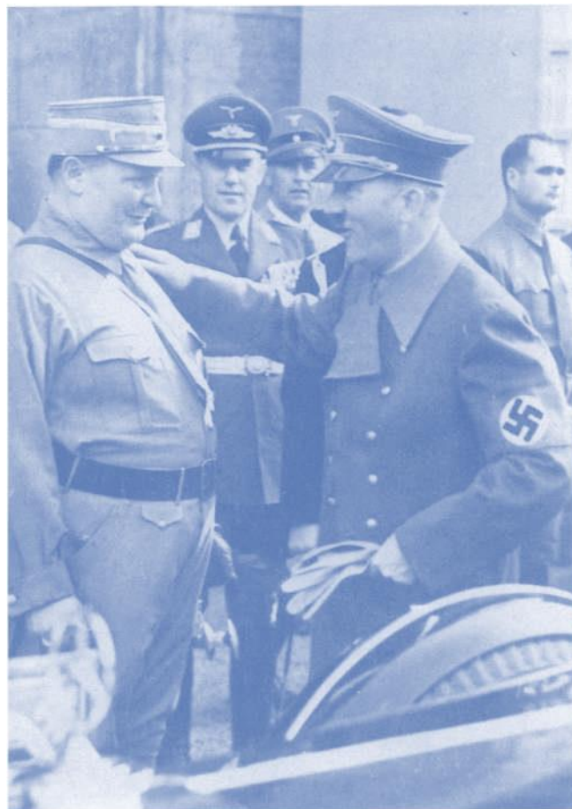
Der «Führer» und sein «treuer Schildknappe» (Zitat Goebbels) auf dem Reichsparteitag in Nürnberg