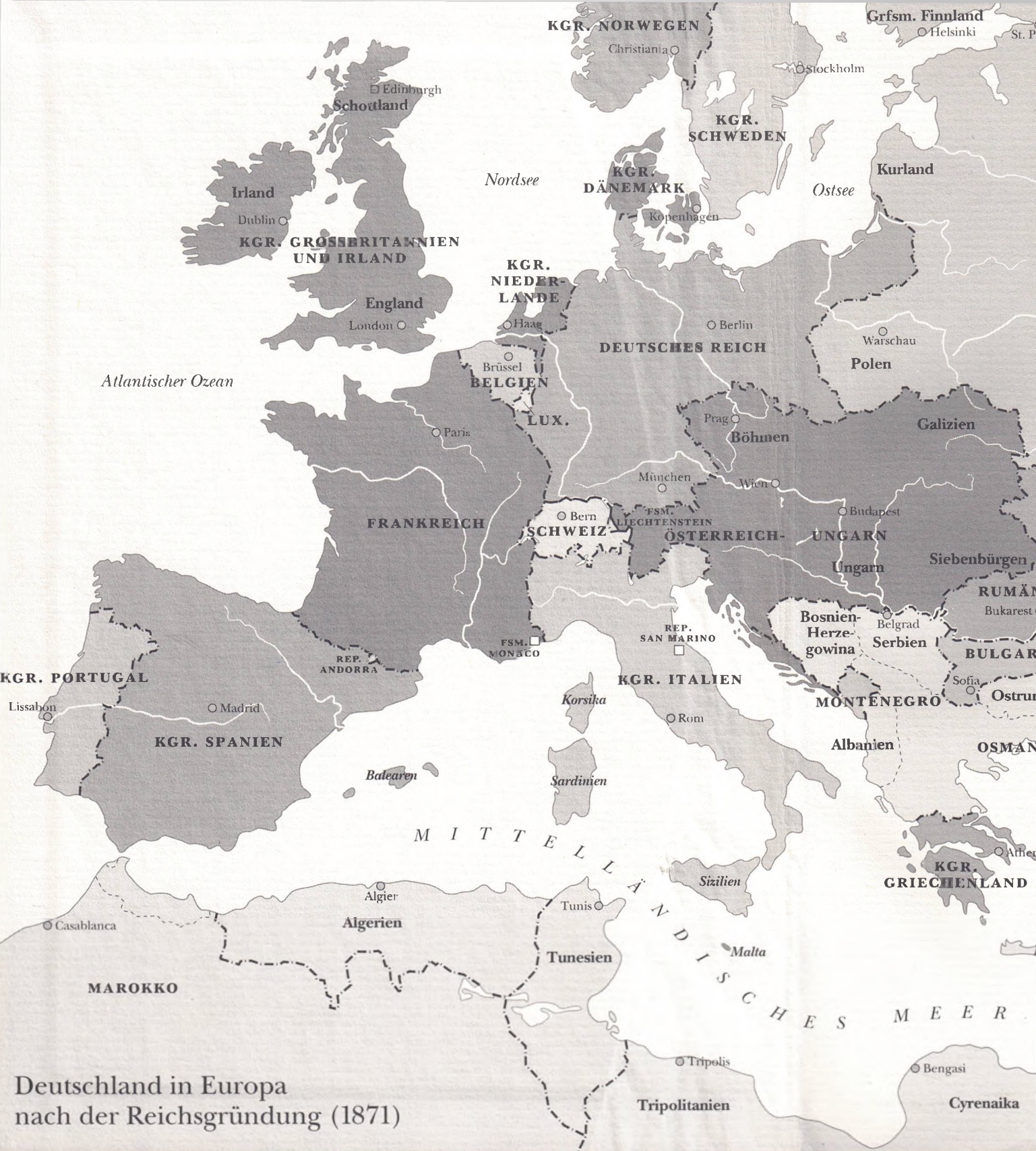
Deutschland in Europa nach der Reichsgründung (1871)