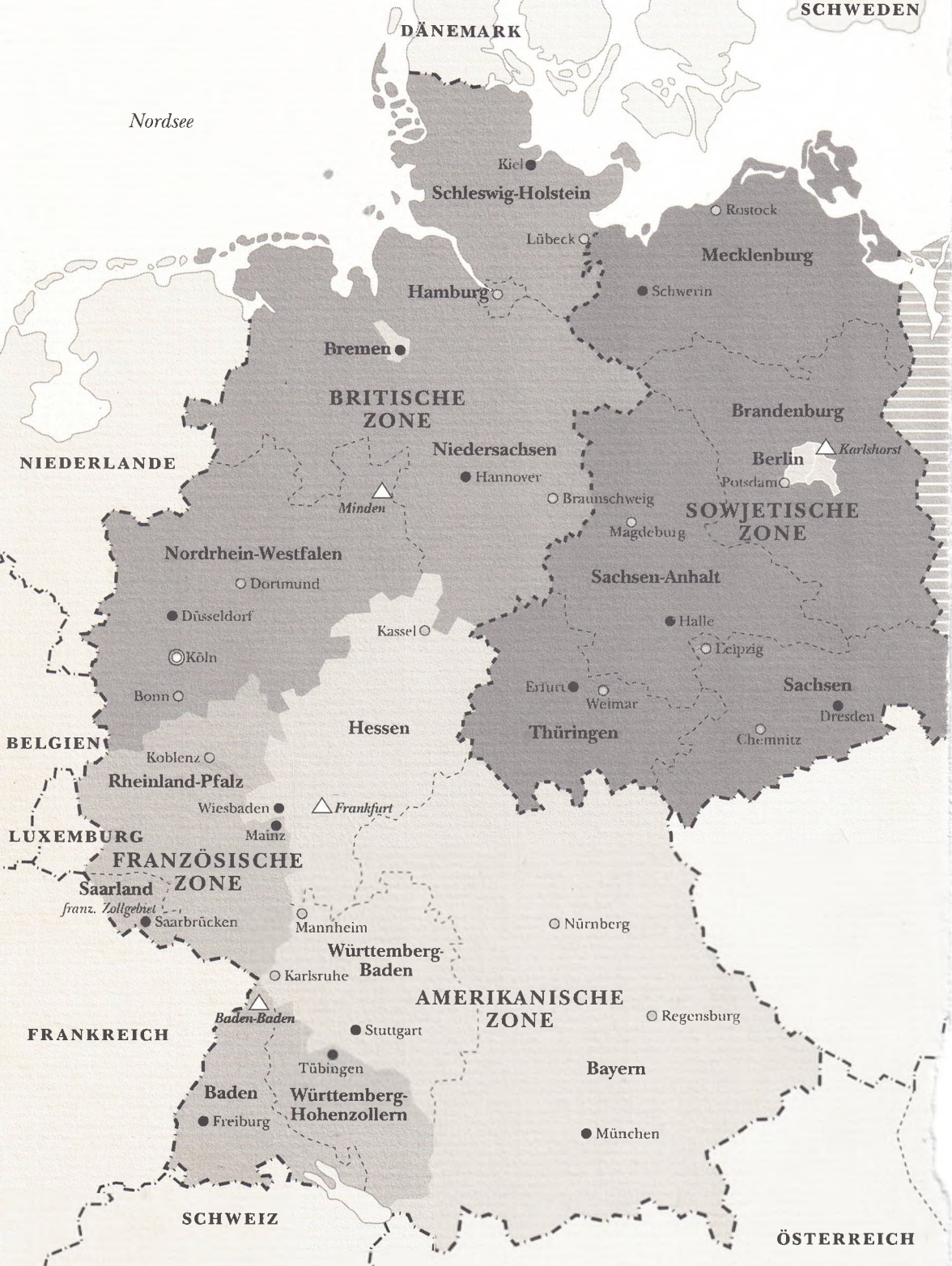
Das geteilte Deutschland nach dem Ende des Zweiten Weltkriegs (1945/47) △ Alliierte Hauptquartiere