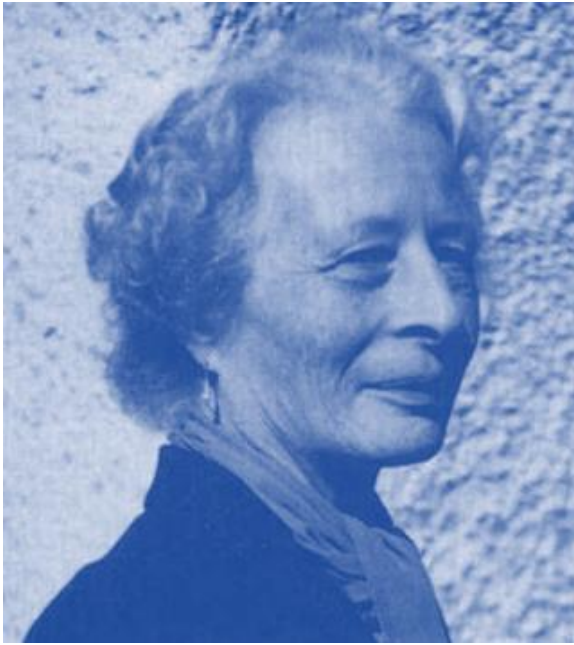
«Da geht Preussen»: Die Mutter.

kein Problem, mit Holz aber sehr wohl. Es gelingt meistens, wenn die Glut sorgfältig mit Asche abgedeckt wird.