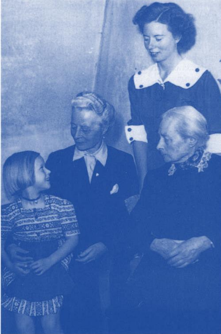
Urahn, Grossmutter, Mutter und Kind... Eine Aufnahme etwa um 1950.