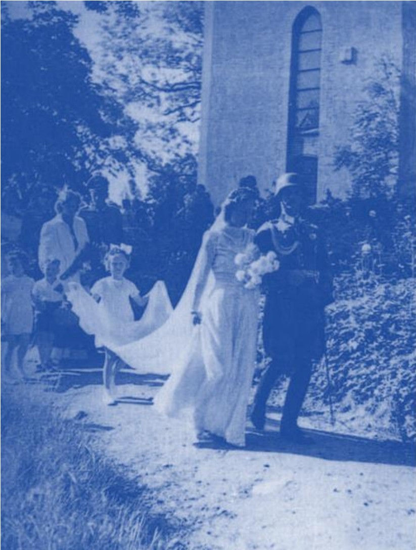
Vor der Kirche in Glowitz. Laut Dienstvorschrift hat der Bräutigam einen Stahlhelm zu tragen.