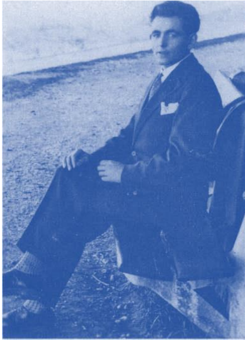
Georg Elser in den zwanziger Jahren