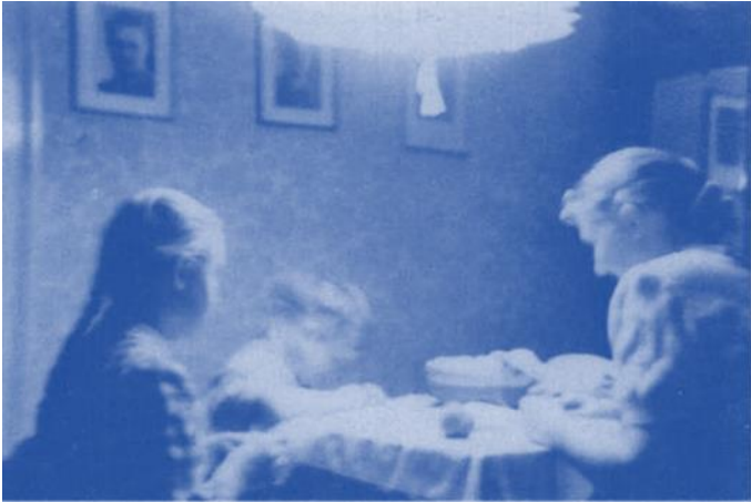
Die Bilder der Verstorbenen zierten die Wohnzimmerwand.