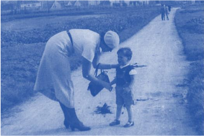
Johanna Haarer mit einem ihrer Söhne beim Spaziergang

war die Regieanweisung für die Erziehung des Nachwuchses zu ideologisch manipulierbarem Menschenmaterial, in treuer Gefolgschaft zum Führer, bis in den Untergang.