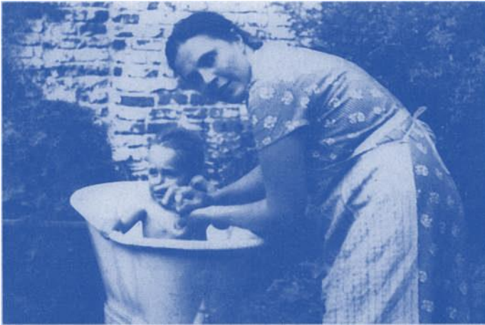
Johanna Haarer beim Baden eines ihrer Kinder

dessen Geschwistern zuteilwurde. Für ihn ist das von Satz zu Satz Erschreckende, dass seine Grossmutter damals keine abstrakten Theorien verkündete, sondern aus eigener Anschauung schrieb. Sie hatte anfangs Erfahrung mit Zwillingen, schliesslich mit fünf kleinen Kindern. Denen hat sie selbst angetan, was sie anderen predigte. Johanna Haarer hatte sich offenbar nicht verbiegen müssen, um eine der Stützen der nationalsozialistischen Erziehungs-offensive zu werden.