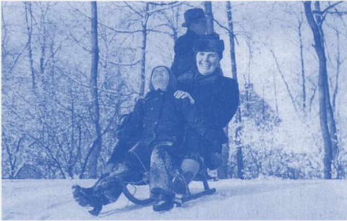
Eine Schlittenpartie: Johanna Haarer mit einem ihrer Kinder